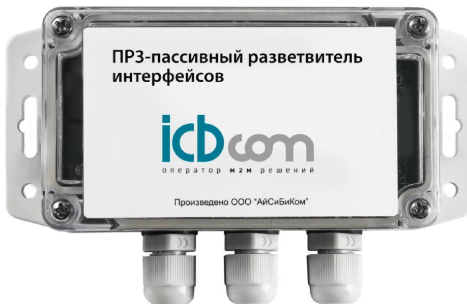
Рисунок 1 – Внешний вид устройства

Внешний вид разветвителя интерфейсов ПРЗ представлен на рисунке 1.