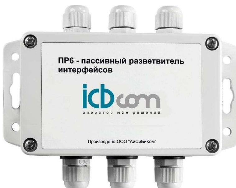
Рисунок 1 – Внешний вид устройства

Внешний вид Разветвителя интерфейсов ПР6 представлен на рисунке 1.