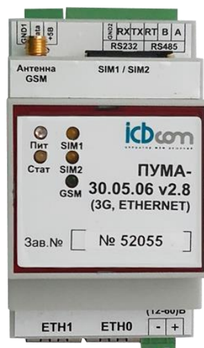
Рисунок 1 - Внешний вид контроллера

Внешний вид контроллера представлен на рис.1.