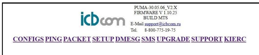
Рисунок 2 – Форма загрузки Web-интерфейса

Для изменения параметров необходимо войти в меню «Setup» (рисунок 3), после чего появится форма, в которой следует сделать необходимые настройки: